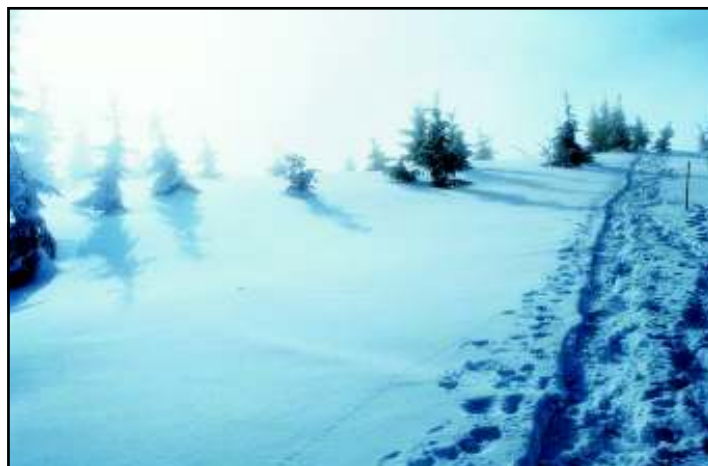
Kocsis (Tunyogi Csapó) Gábor