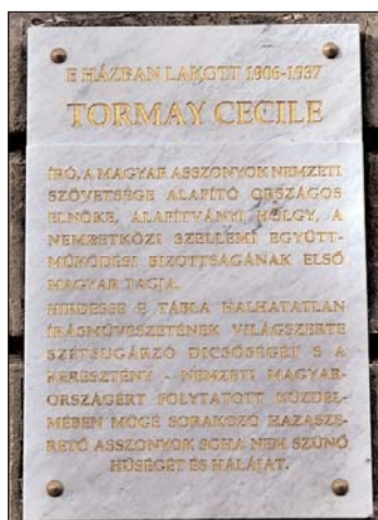
Emléktábla hajdani lakóhelyén

Szerb Antal, a Nyugat 1937. 5. számában így méltatja az írónt. „Fellépése körülbelül egybeesett a Nyugat nagy nemzedékének fellépésével. Első novelláskötete már 1900-ban megjelent, de első sikerét csak 1911-ben érte el az Emberek a kövek közt c. regénnyel és az a műve, amelynek népszerűségét köszönhetette, a Régi ház , 1915-ben jelent meg. A Nyugat -nemzedékkel nemcsak annyiban volt rokon, amennyire egy nemzedék tagjai elkerülhetetlenül rokonok szoktak lenni, ha tehetségesek: nyugatos volt a szó alapvető, a Nyugat -mozgalomtól független értelmében is, a nyugati irodalmak rajongója és követője volt; és «nyugatos» volt művészi szándékának mélyén is, a művészetről alkotott víziójában. Artisztikus író volt, a finom, lelkiismeretes kidolgozott részletek, a tűnő és csendes hangulatok, az önmagukért megbecsült ritka szavak és hasonlatok írója, dekoratív tehetség és a szó nemes értelmében dekadens. Öncélú mondatokat írt, amelyek arra voltak rendelve, hogy ötvözött formásságukban a kontextusból kiszakítva is megállják a helyüket és megállítsák, elmerengésre hívják az olvasót, fel-