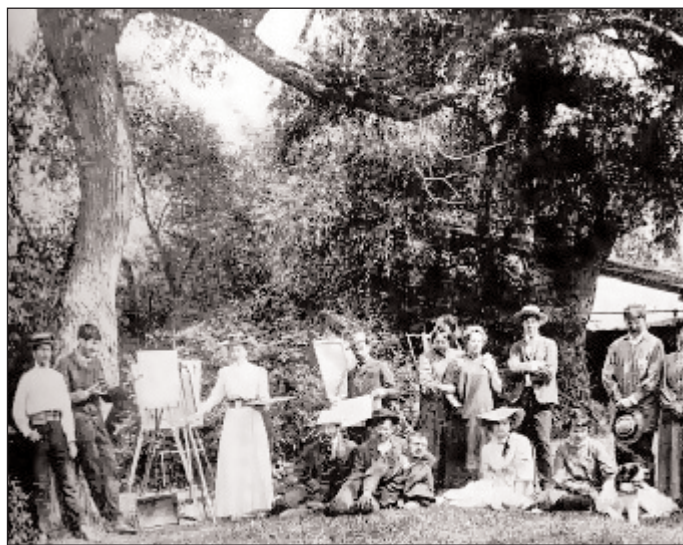
Hollósy és iskolája